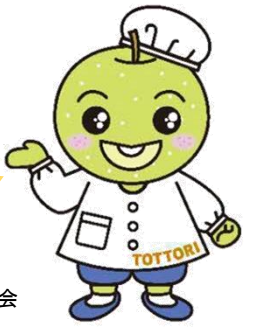
鳥取県学校栄養士協議会 キャラクター「なしっち」

「とっとり県民の日」に各給食センターで提供を予定している献立の中から、レシピを紹介いたします。ご家庭でも、ぜひ作ってみてください！