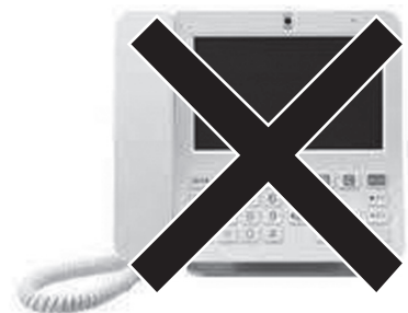
旧 IP 告知端末