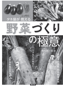
タネ屋がこっそり教える野菜づくりの極意 農山漁村文化協会