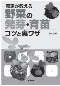
農家が教える野菜の発芽・育苗 コツと裏ワザ 農山漁村文化協会

暦の上では春となり、野菜の植え付けや種まきを考える時期になりました。野菜づくりの初心者も熟練者も、今年のカリを成功させるために、土づくり等の畑の準備をしておきましょう。