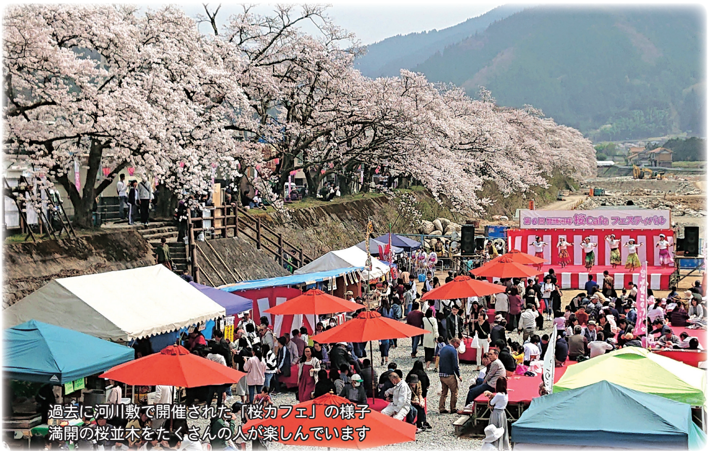
過去に河川敷で開催された「桜カフェ」の様子 満開の桜並木をたくさんの方が楽しんでいます