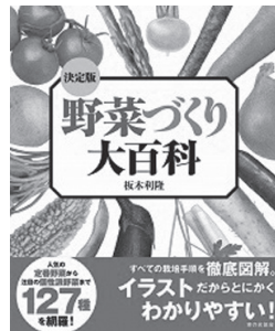
野菜づくり大百科決定版 長本利隆 家の光協会