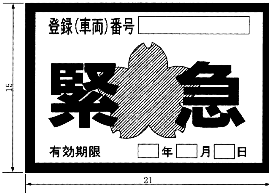
様式 3 4 緊急通行車両を証明する標章