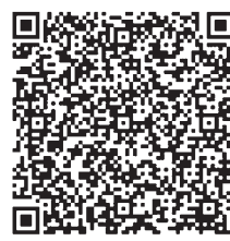
とっとり電子申請サービス