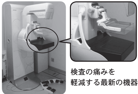
検査の痛みを軽減する最新の機器