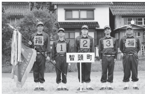
▲小型ポンプ操法で優勝した 富沢第1分団の皆さん

6月11日（日）、鳥取県東部地区消防ポンプ操法大会が開催され、本町を代表して富沢第1分団と第6号車分団の2隊が出場しました。