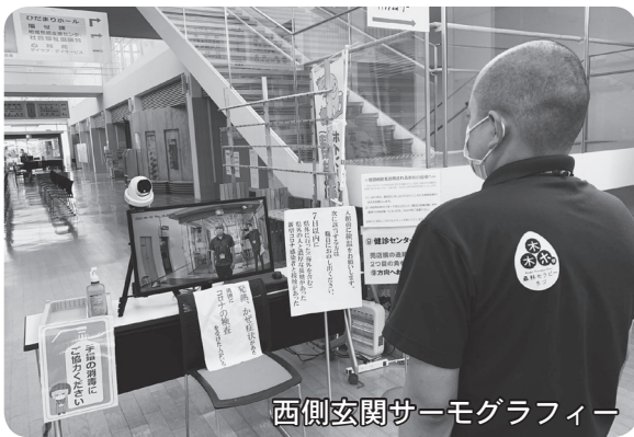
西側玄関サーモグラフィ

定期検診の人でも、症状はなくても県外への往来や親しい人がコロナウイルス陽性者もしくは濃厚接触者であるなど、感染リスクの高い行動があった人も事前に連絡ください。受診方法について説明させていただきます。場合によっては、診察・検査の日程を変更させていただきます。