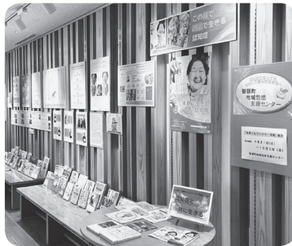
昨年のエントランス展示

毎年9月21日は「世界アルツハイマーデー」に制定され、この日を中心に9月を「世界アルツハイマー月間」として、本町でも認知症についての色々な取り組みがされてきました。