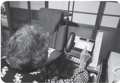
告知端末を使った予約の様子

本町でも、令和3年度に山形・山郷地区で実証実験を行い、本格導入に向けて準備を進めています。