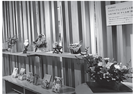
フラワーアレンジメント展示の様子

図書館に入って左側にある エントランスでは、住民の皆 さんからの提案により、多く の作品展示を行ってきました。 写真、絵手紙、絵画、フラ ワーアレンジメントなど、皆 さんの作品を展示していただ けます。 展示を希望される人は、職 員に問合せください。展示期 間や内容、展示方法などを相 談させていただきます。