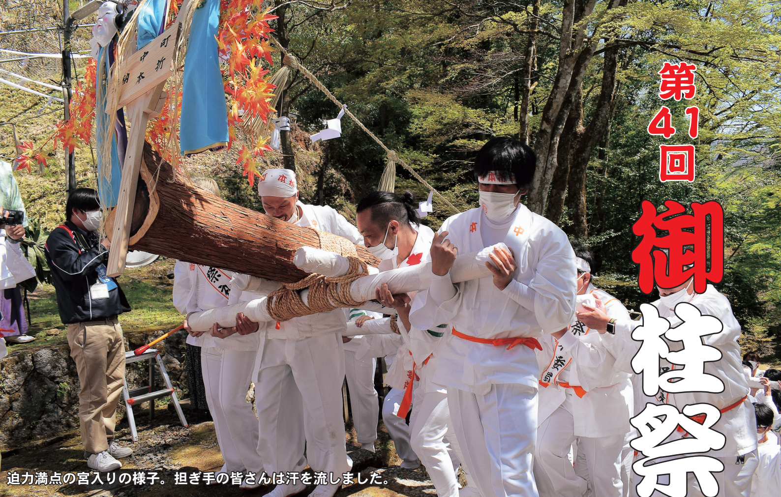
迫力満点の宮入りの様子。担ぎ手の皆さんは汗を流しました。