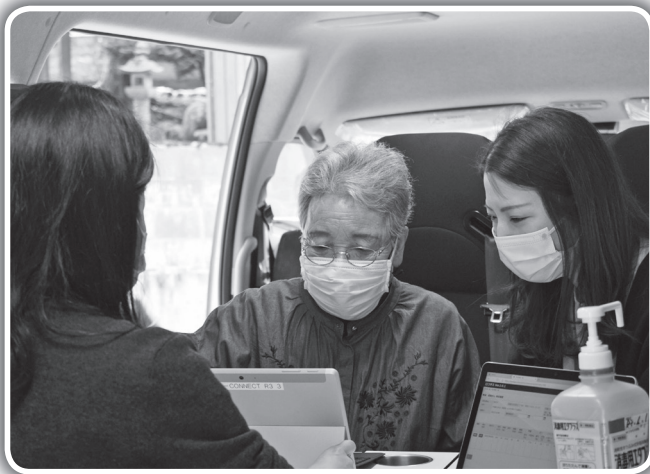
智頭病院と接続された車内で健康相談をする様子