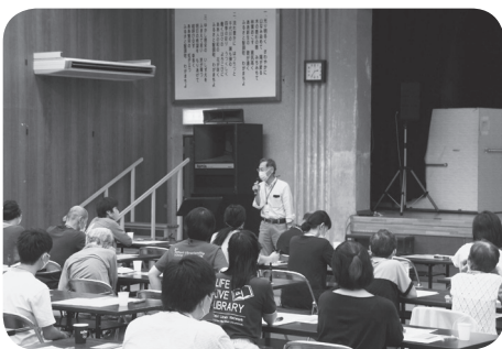
ボランティア活動を呼びかける 「図書館を考える会」代表