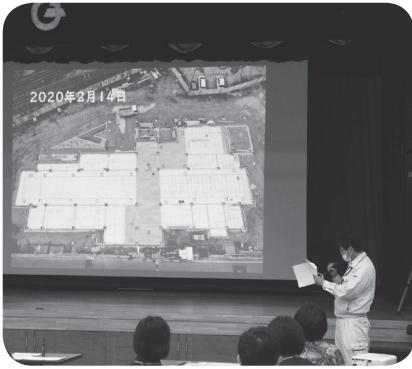
工事状況を説明する現場責任者

今回は、建設工事状況の報告や中学生の新図書館プロジェクトの様子を紹介しました。また、新図書館のオープンニングイベントについて参加者の皆さんからの提案や「図書館を考える会」の皆さんから新図書館でのボランティアについての呼びかけなどもあり充実した会となりました。