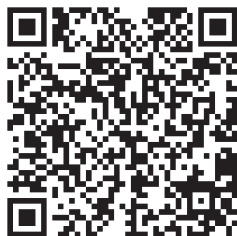
自治体ナビ QR コード

マイナンバーカードの取得やマイキーIDの設定方法については、「自治体ナビ」をご覧ください。役場総務課もしくは税務住民課まで問合せください。