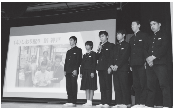
発表する智頭中学校の生徒たち

智頭小学校人権教室 12月3日(火)智頭小学校 智頭小学校1年生を対象に、人権擁護委員会による人権教育が行われました。 「いっちゃん、ごめんね。」の読み聞かせの後、友達の気持ちを考え、想像し、どんな声かけをすればいいのかを伝え合い、授業の最後には、人の悪口は言わないと約束をしました。 積極的に発言する子どもたちの姿に、授業の成果を感じました。