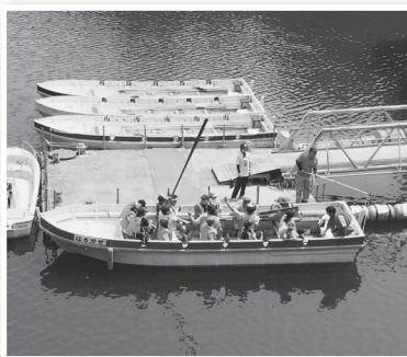
カッター活動の様子