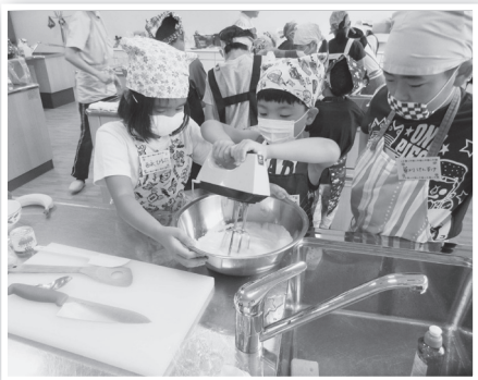
おやつづくりの様子

小学生22人が給食センター職員の手ほどきを受けながら、「オムレット」と「和風ブラマンジエ」を作りました。