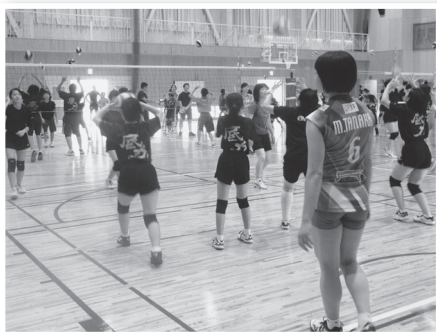
実技講習会の様子

プロの選手・コーチによる実技講習会・質問コーナーや記念撮影・サイン会では子どもたちをはじめ、たくさんの素敵な笑顔で溢れていました。