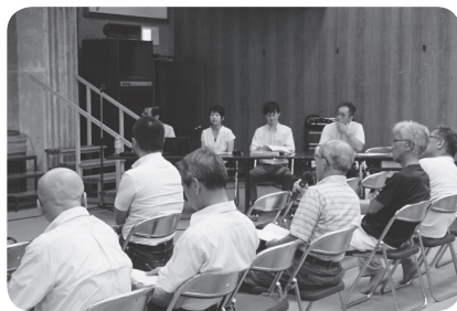
※説明会の資料は、智頭図書館で希望者に配布しています。

設計者からの設計説明後、工事担当者から工事についての説明を行いました。現在、全国的な建築資材の不足により工期が延長される見込みであることや、工事車両の通行についてなど具体的な説明を行いました。