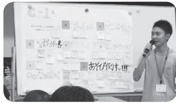
第6回住民ワークショップの様子