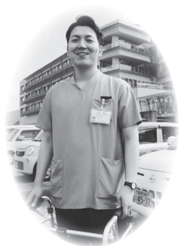
グレーのスクラブ

訪問リハビリテーション 皆さんのご家庭を訪問し、実際の生活場所で動作の練習や安全な生活方法などをアドバイスします。この他にも、体の状態にあった福祉用具や住宅改修の相談対応等も行って