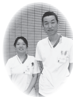
白地に襟元がピンク・緑のスクラブ

検査室では血液や尿の検査、心電図や超音波（エコー）検査を行っています。放射線室では医療における放射線を扱い、レントゲン検査やCT検査等を行っています。当院では7人の有資格者が勤務して