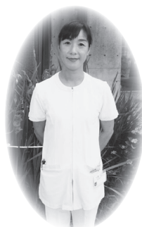
白地にピンクのスクラブ

主に外来歯科診療と通院が困難な人の訪問歯科診療を行っています。歯科衛生士1人で口腔ケアや口腔リハビリテーションを行っています。