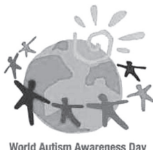
World Autism Awareness Day

「発達障害」 は自閉症スペ クトラム障害 (自閉症、ア スペルガー症 候群など)、学習障害、注意欠 陥多動性障害(AD/HD)など を指し、生まれつきもっている 脳機能の障害です。