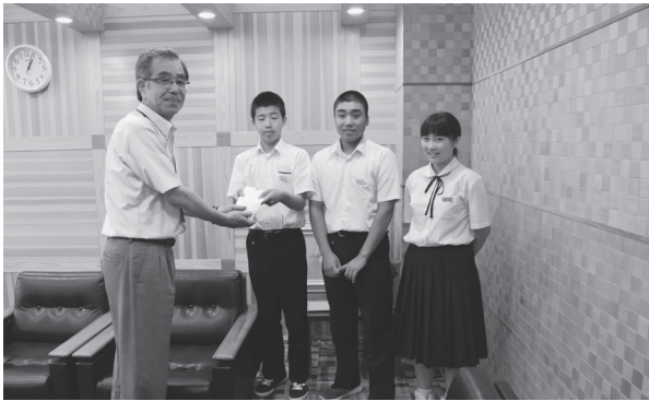
募金をいただきました

7月の豪雨によって町内で被害が出る中、智頭中学校生徒の皆さんが募金を集め、たくさんのお金を本町に寄付いただきました。 副町長は「このお金は智頭中学校の生徒、町民の思いが詰まっている。町のために使い道をしっかりと考えていきたい」と話しました。皆さんが安心して暮らせるよう、一日も早い復興に向けて取り組んでいきたいと思えます。