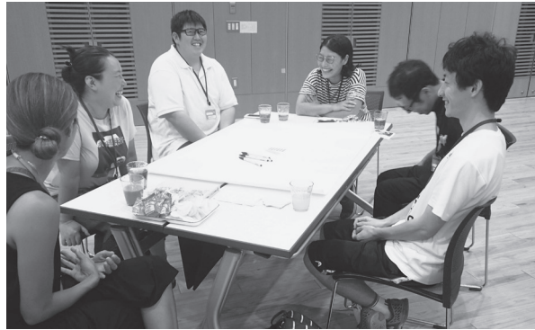
オープン会議の様子

「まんぐるじゅう集合！」の第1回目が開催されました。これは、色々な情報が欲しい人、やりたい事のために仲間が欲しい人など誰でも気軽に参加できる会議です。 これまでに無い案を出し合い、新たな本町のまちづくり実現に向けて話し合い、連絡先を交換するなど自由な会議となりました。