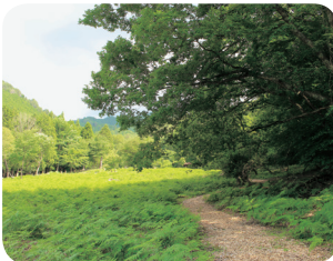
天木森林公園コース