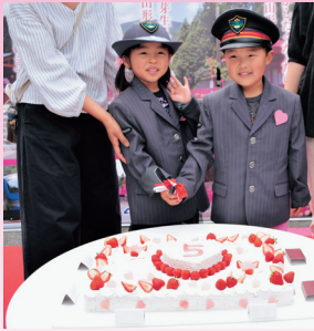
5周年を記念した ケーキの入刀