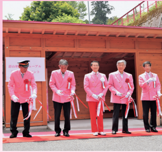
「恋の待合室」オープンの テープカット

恋山形がピンク色の「恋がかなう駅」としてリニューアルされてから5周年を記念したイベントが開催されました。