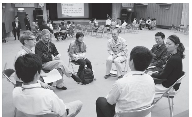
グループレクリエーションの様子

健康ポイント抽選 平成28年度から始まった智頭町健康ポイント事業ですが、平成29年度は20ポイント達成者の中から、町長による抽選で3人に杉小判5千円分を贈呈しました。 今年度は対象者を5人に増やし、5千円相当の景品を贈呈します。自分の健康のためにも、健康ポイント事業に参加してみてください。