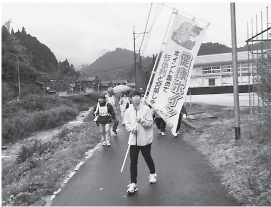
健康ポイント事業のウォーキングの様子

包括的連携協定を結びました 4月26日(木)智頭町役場前 本町と智頭町内郵便局3局及び鳥取郵便局が福祉サービスの向上と経済発展を図り包括的な連携に関する協定を締結しました。 本町の主要施策である「森林セラピー®」を周知すると共に手紙文化振興と本町の地域振興の展開を目的にラッピングポストが設置されました。お披露目式ではちづ保育園の園児たちが書いた手紙をポストに入れました。