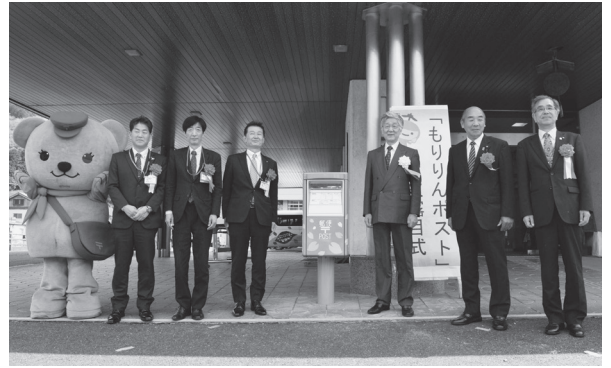
ラッピングポストお披露目

那岐登山ふれあい大会 4月29日(日)那岐山 第33回那岐登山ふれあい大会が開催されました。 智頭町側からは140人、奈義町側からは300人程度の参加者がありました。 今年には昨年に比べ天気が良く、山頂付近の広場で行われたじゃんけん大会やクイズ大会などのイベントで盛り上がりました。参加者からは「こんなに天気がいいふれあい大会は久しぶりで気持ちがいい」という声もいただきました。