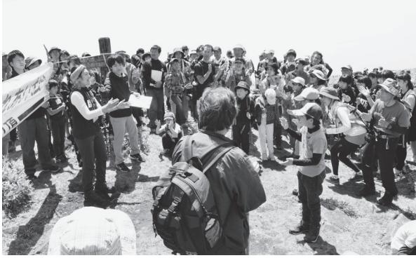
全員参加のじゃんけん大会

那岐登山ふれあい大会 4月29日(日)那岐山 第33回那岐登山ふれあい大会が開催されました。 智頭町側からは140人、奈義町側からは300人程度の参加者がありました。 今年には昨年に比べ天気が良く、山頂付近の広場で行われたじゃんけん大会やクイズ大会などのイベントで盛り上がりました。参加者からは「こんなに天気がいいふれあい大会は久しぶりで気持ちがいい」という声もいただきました。