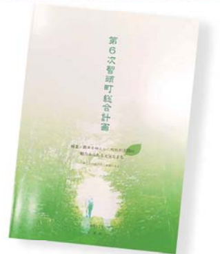
第6次智頭町総合計画

このプロジェクトでは10か年計画となる第7次智頭町総合計画の策定を行います。総合計画とは、町で行われる施策の指針となるものです。すなわち、10年後の智頭町がどうあるべきかを考え、それを実現するための町の施策のあり方を明らかにします。現状の課題と町民の意見を受け止めた上で計画を立てることで町民の生活をより豊かで活力あるものにするをねらいとしています。町民のみなさんにプロジェクトに参加していただくことで、町・町民・行政が同じ方向を向いて進んでいくことができればよいと思います。今後は策定委員会と協議しながらみなさんの意見を反映させた計画を作っていく予定です。