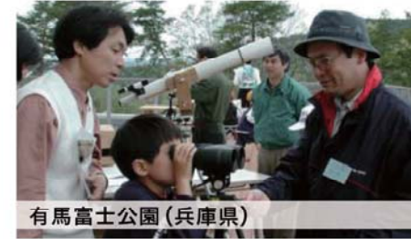
有馬富士公園 (兵庫県)

コミュニティデザインとは、地域の人たち自身が自分たちの地域の将来を考えて、その将来に向けて活動を、デザインの力でお手伝いする仕事です。2005年から10年間、各地で実施してきたプロジェクトをご紹介します。