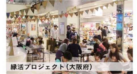
縁活プロジェクト (大阪府)

行政が全て運営管理するのではなく、市民活動を公園の運営管理へとリンクさせるパークマネジメントを展開したプロジェクト。公園内で市民に活動してもらうことで、遊びに来た人との対話を生み出す仕組みをつくりました。生き物観察や凧あげの団体などが日替わり、週替わりで継続して活動しています。