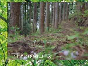
こもれびの森コース