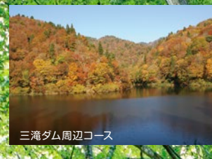
三滝ダム周辺コース