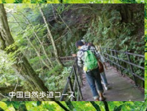
中国自然歩道コース

智頭町での森林セラピーの特長は、降雨・降雪の多い気候が育んだ深い緑の森と豊富な清流とが織りなす渓谷美を同時に体感できることです。また、智頭町の森林セラピーロードを代表する芦津渓谷は、西日本屈指の渓流で天然杉と広葉樹の混交林が四季を通して美しく、中国自然歩道から三滝ダム周辺を巡り、さらに源流域の渓谷へと続き、それぞれ異なる表情を魅せる3つのコースが設定されています。